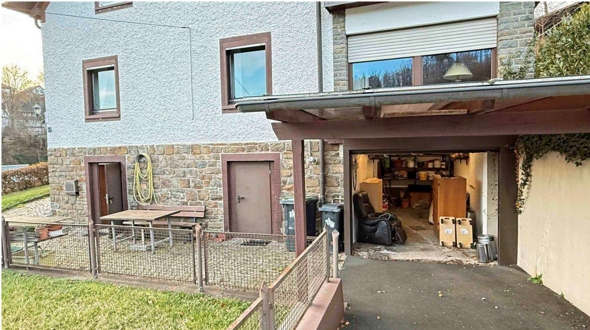
Garage, Carport und ebenerdig begehbare Keller