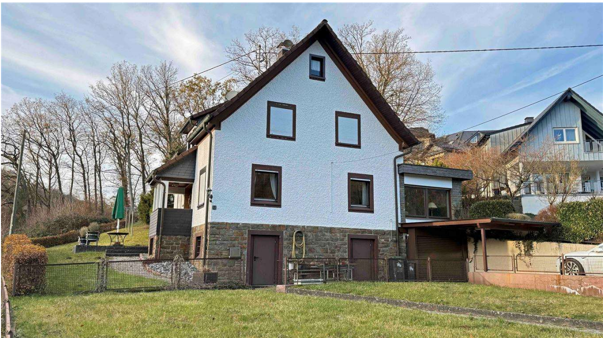
Wohn-/ Nutzfläche auf 4 Etagen