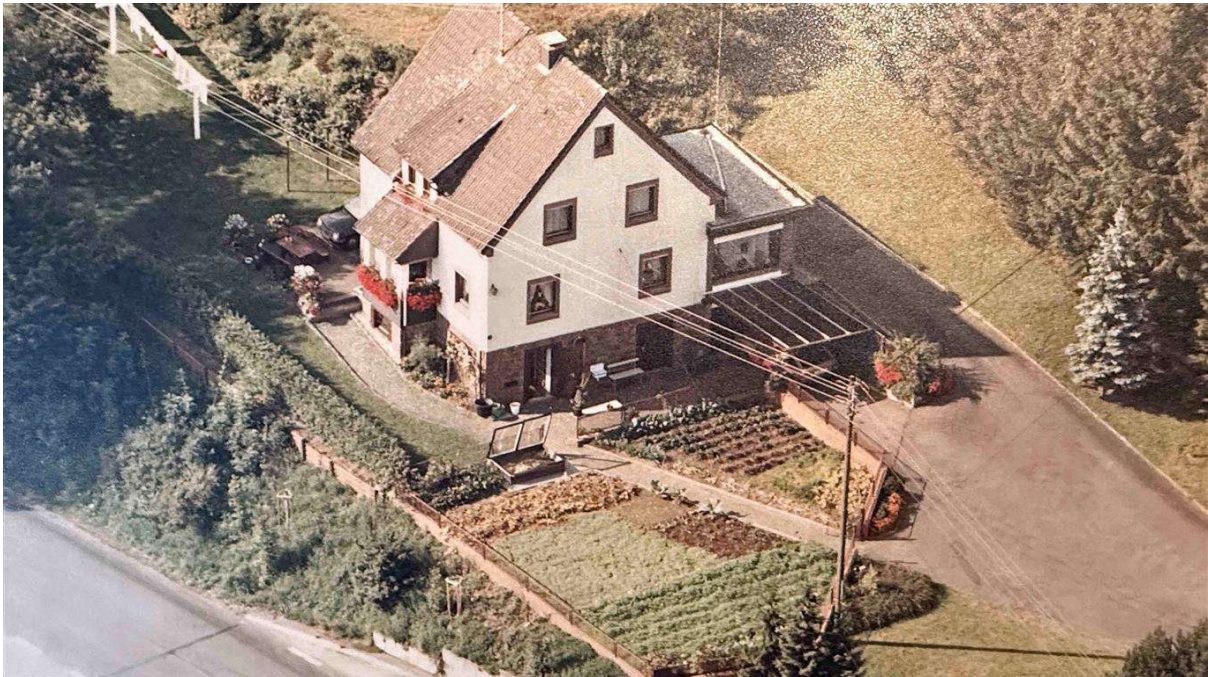
Luftaufnahme ca. 1980 und...