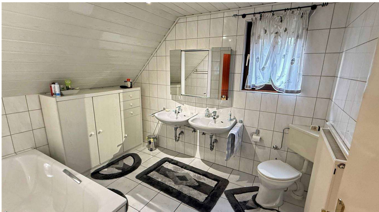
...ein helles, freundliches Wannenbad im Dachgeschoss