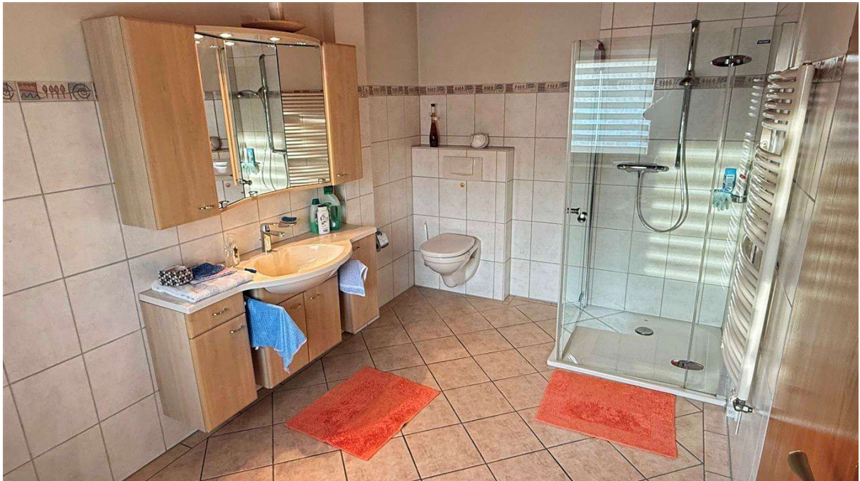
geräumiges Bad mit großer Dusche und...