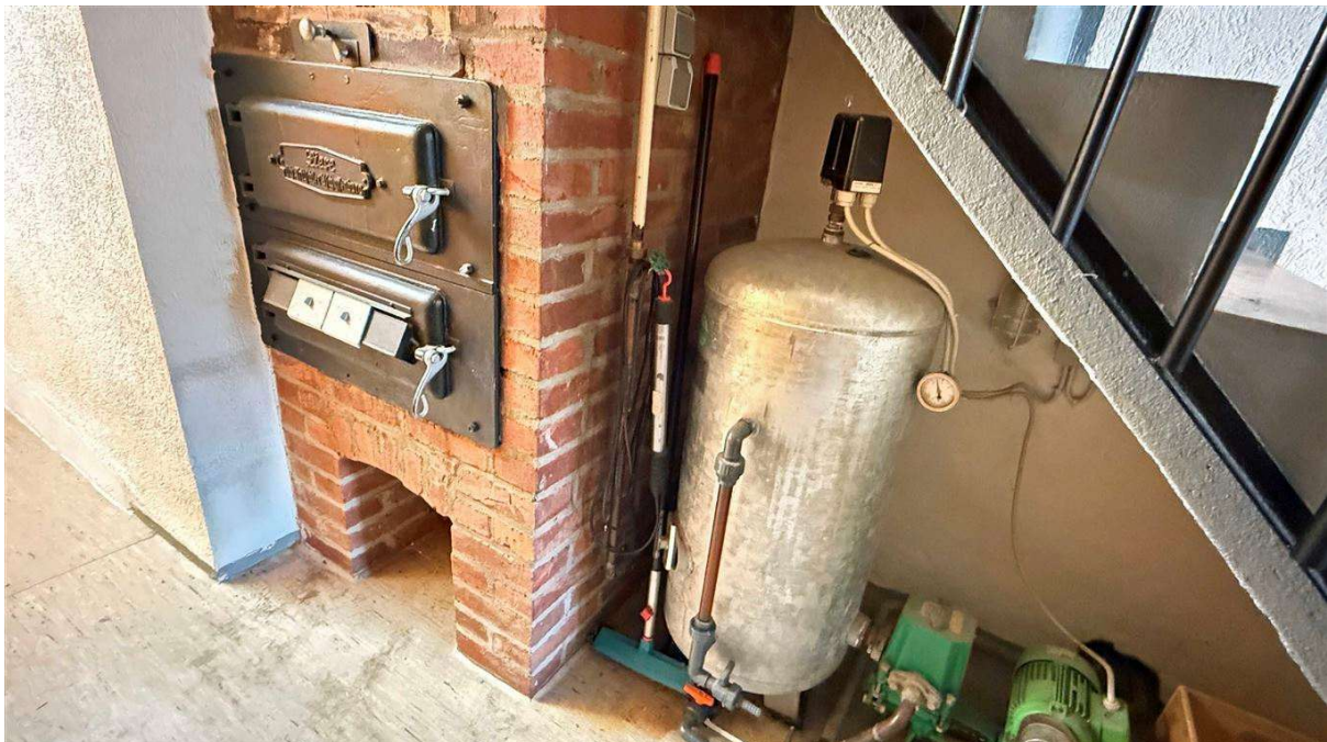
der "Backes" und (mögliche) eigene Wasserversorgung