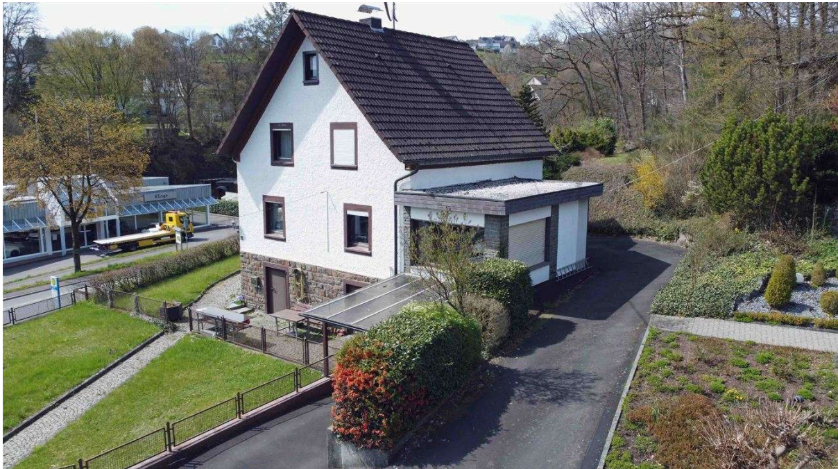
Rückseite mit Wohnzimmeranbau (Baujahr 1970)