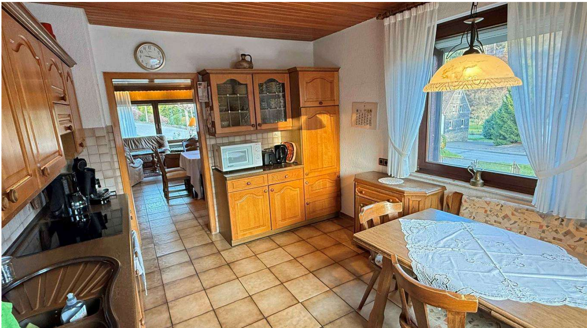
Wohnküche 13,1 m 2 mit angrenzendem Wohn-/Esszimmer