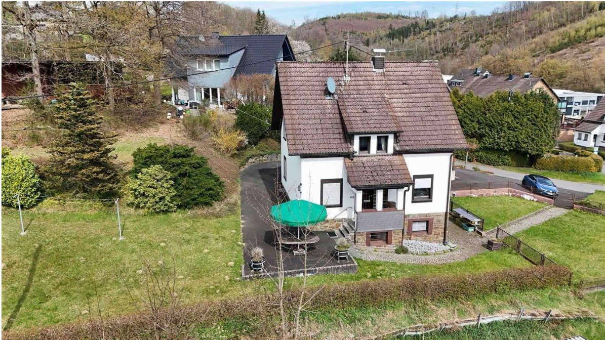
Frontseite mit Haupteingang / Terrasse