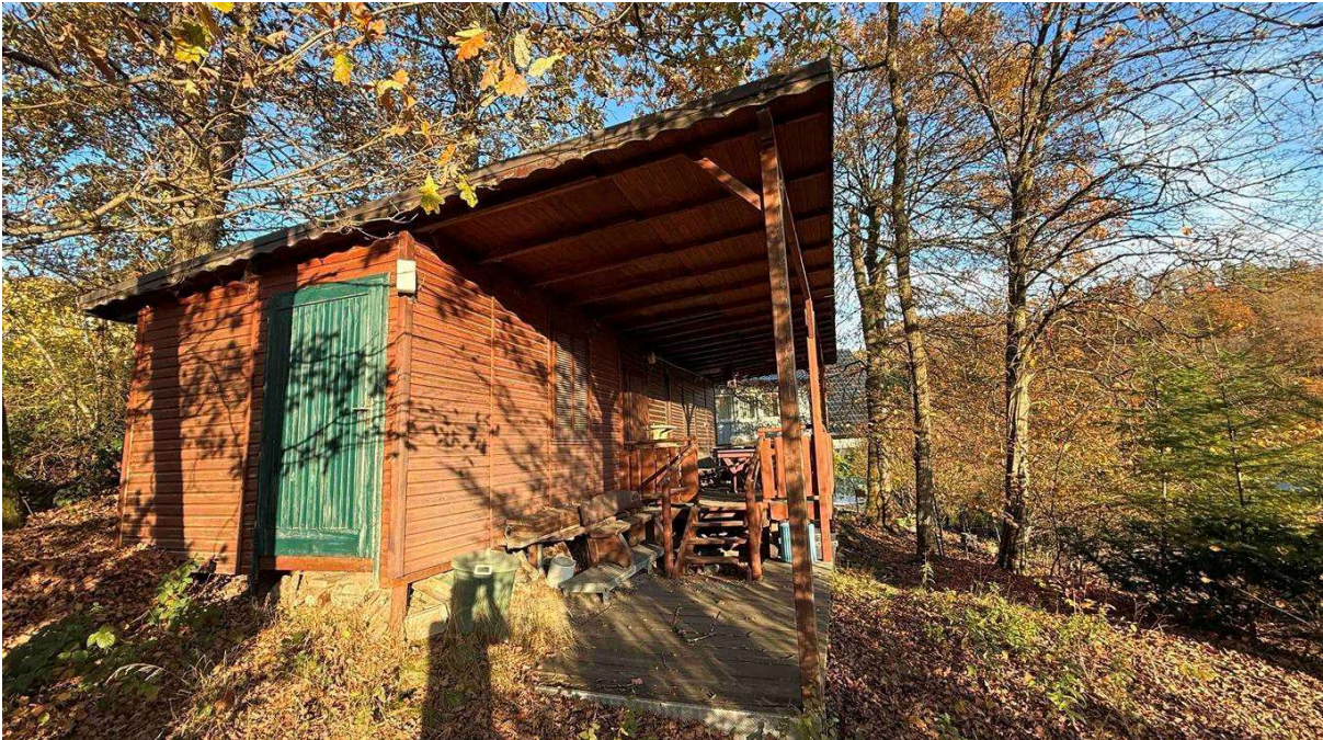
im eigenen Wald versteckte Holzhütte mit...