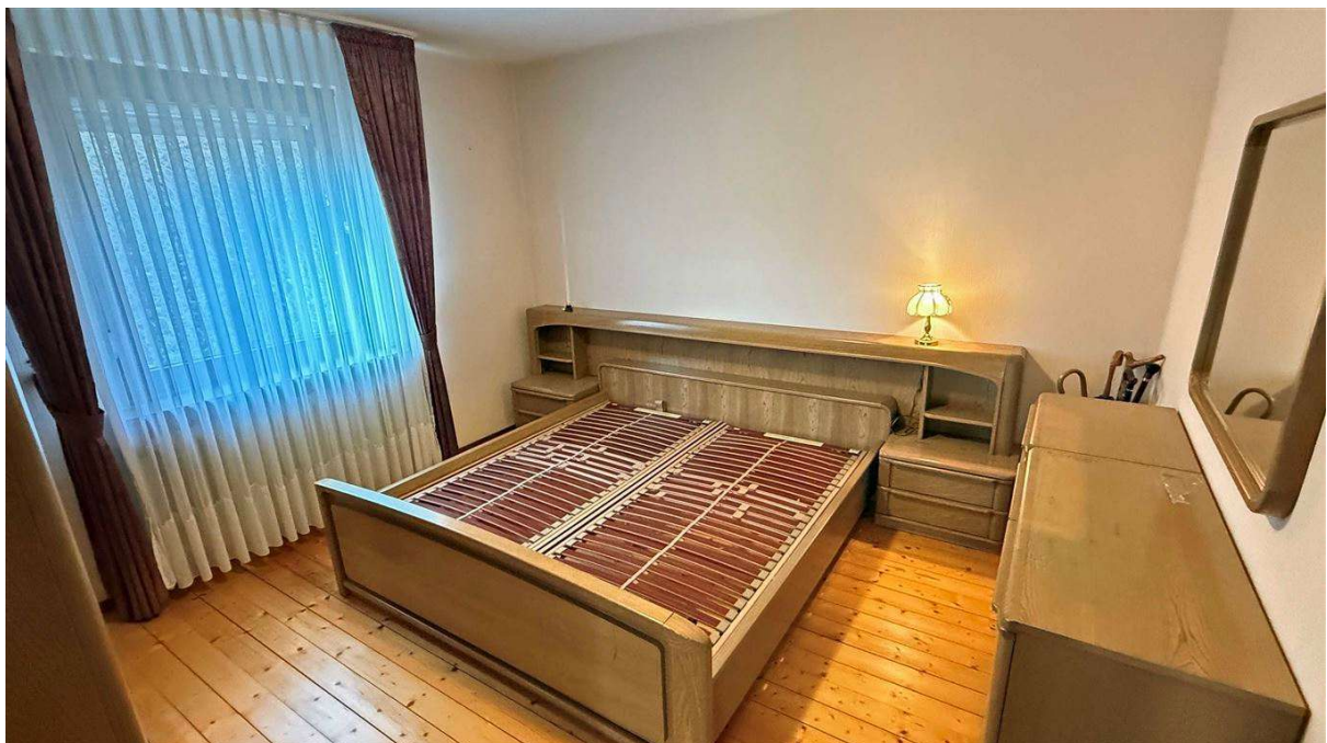
...angrenzendes Schlafzimmer mit Holzdielen im Erdgeschoss