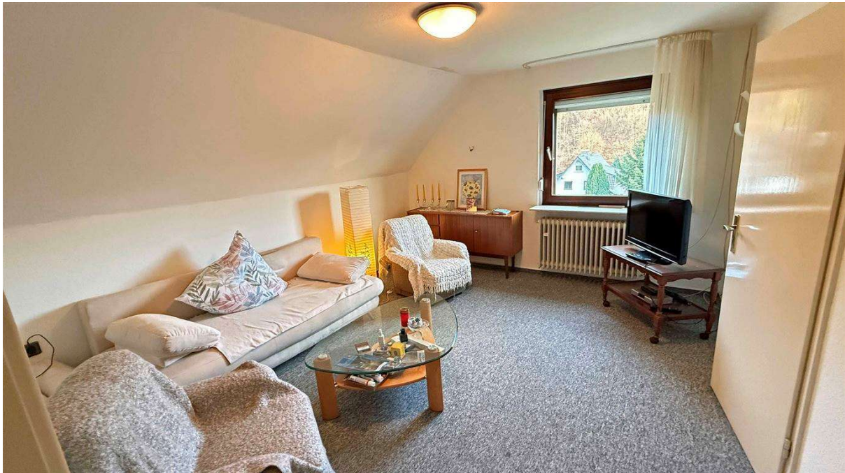
3 Schlafzimmer (14,3 m 2 / 13,8 m 2 und 11,8 m 2 ), sowie...