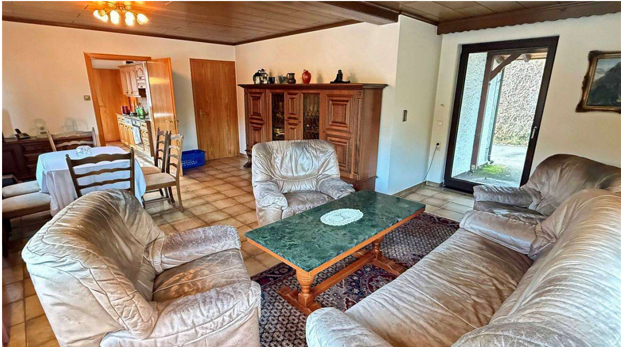
Wohn-/Esszimmer 32,5 m 2 mit Nebeneingang (rechts) und...