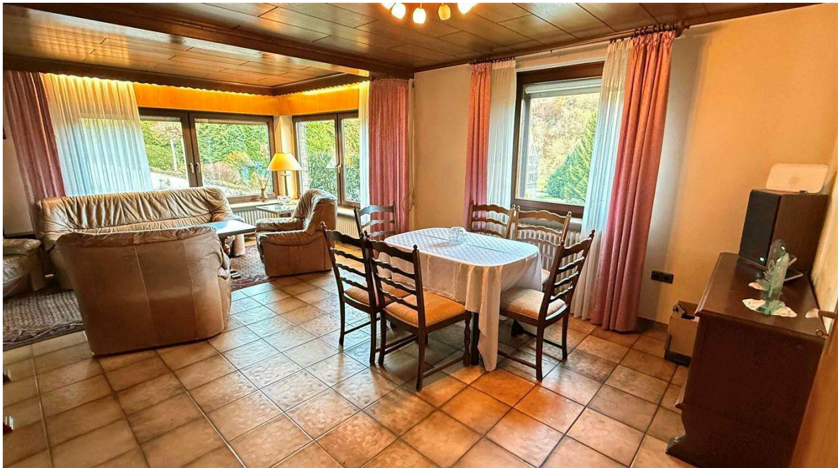
...3 Panoramafenster mit Blick ins Grüne