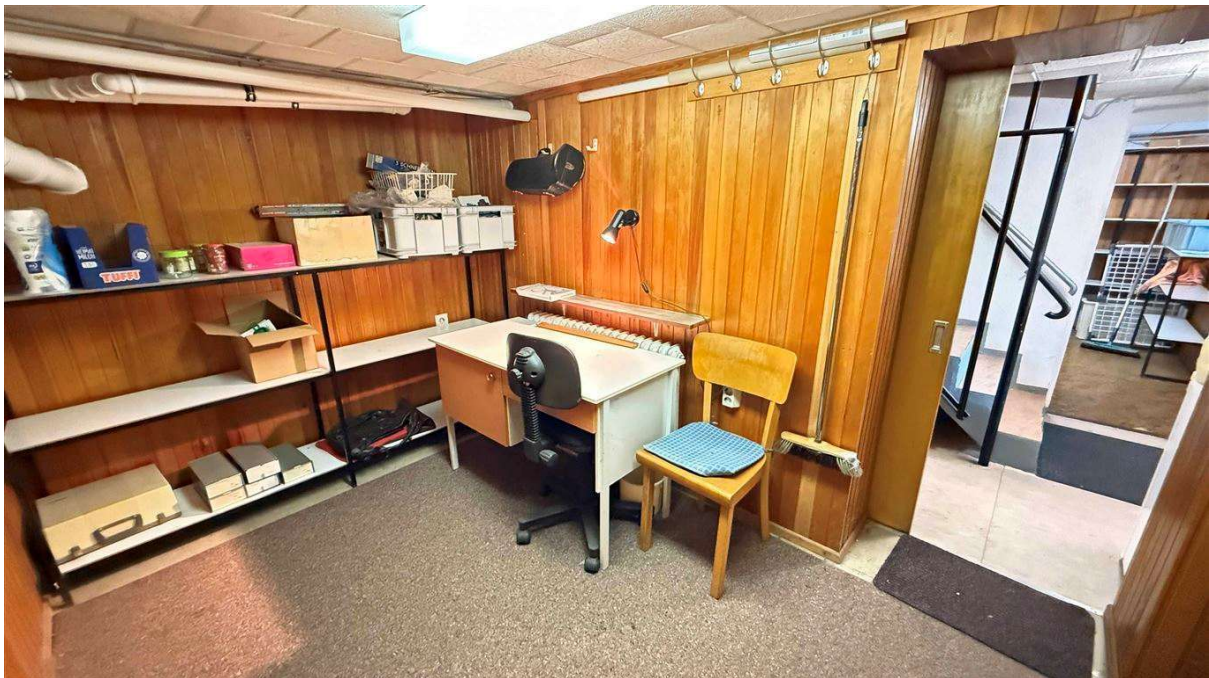
z.T. wohnlich ausgebauter Keller mit...